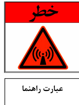
شکل ۱- علامت های احتیاط، هشدار و خطر