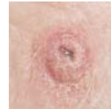
شکل ۲. شمایی از سرطان سلول‌های سنگفرشی (SCC)

سرطان سلول‌های سنگفرشی (شکل ۲) دومین شکل شایع سرطان پوست به شمار می‌رود که می‌تواند تمام بدن از جمله لایه‌های مخاطی را در بر گیرد. اکثر اشکال سرطان سلول‌های سنگفرشی مدت‌ها به لایه اپیدرم محدود می‌ماند و در صورت درمان نشدن به لایه‌های زیرین پوست راه یافته و بافت‌های دیگر را مورد تهاجم قرار می‌دهد. مواجهه ی مستمر اعضای بدن مانند صورت، گردن، اطراف گوش‌ها، پوست سر بدون پوشش مو، دست، شانه، پشت بدن و لب پایین دهان با پرتوهای فرابنفش از جمله علل ابتلا به این نوع سرطان است.