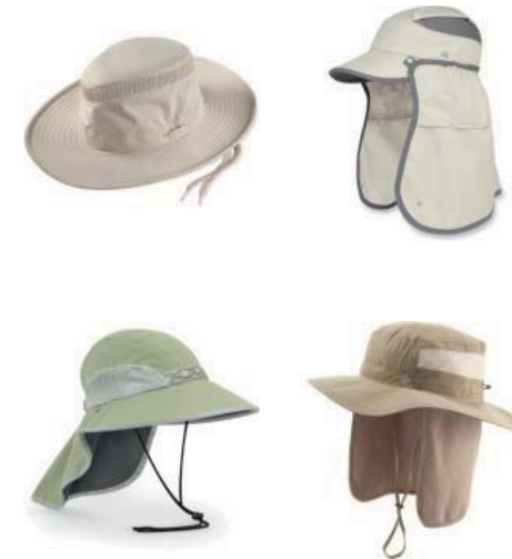
شکل ۵. نمونه ای از کلاه های مناسب مورد استفاده جهت محافظت در برابر پرتوهای فرابنفش