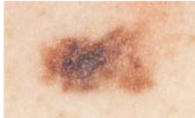
شکل ۳. شمایی از ملانوم بدخیم

افزایش یافته است، به عنوان مثال در ایالات متحده به طور متوسط در هر سال ۴٪ رشد داشته است. مطالعات زیادی نشان داده اند که خطر ابتلا به ملانوم بدخیم به عواملی نظیر مشخصه های ژنتیکی و رفتار فرد در هنگام مواجهه با پرتوهای فرابنفش بستگی دارد.