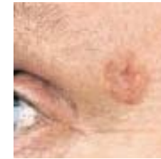
شکل ۱. شمایی از سرطان سلول‌های پایه (BCC)

سرطان سلول‌های سنگفرشی (شکل ۲) دومین شکل شایع سرطان پوست به شمار می‌رود که می‌تواند تمام بدن از جمله لایه‌های مخاطی را در بر گیرد. اکثر اشکال سرطان سلول‌های سنگفرشی مدت‌ها به لایه اپیدرم محدود می‌ماند و در صورت درمان نشدن به لایه‌های زیرین پوست راه یافته و بافت‌های دیگر را مورد تهاجم قرار می‌دهد. مواجهه ی مستمر اعضای بدن مانند صورت، گردن، اطراف گوش‌ها، پوست سر بدون پوشش مو، دست، شانه، پشت بدن و لب پایین دهان با پرتوهای فرابنفش از جمله علل ابتلا به این نوع سرطان است.