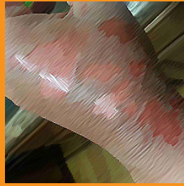
سوختگی درجه ۲