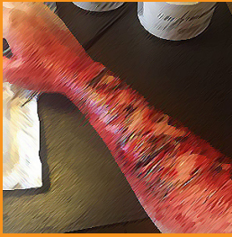
سوختگی درجه ۳