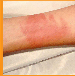
سوختگی درجه ۱